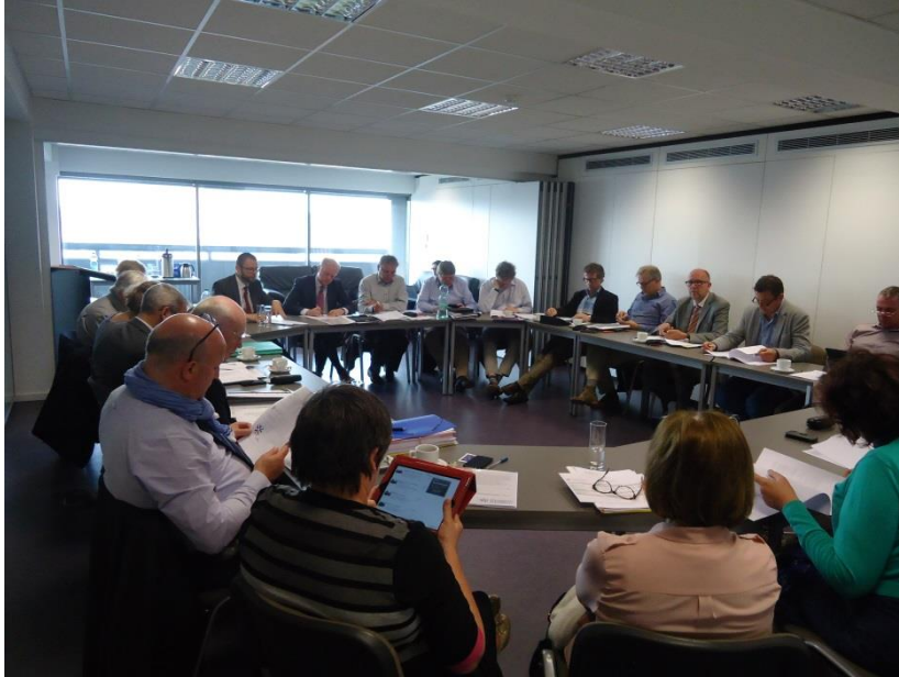
zitting van de Raad van Bestuur

19 januari; 23 februari, 20 april, 18 mei, 21 september, 19 oktober en 14 december.