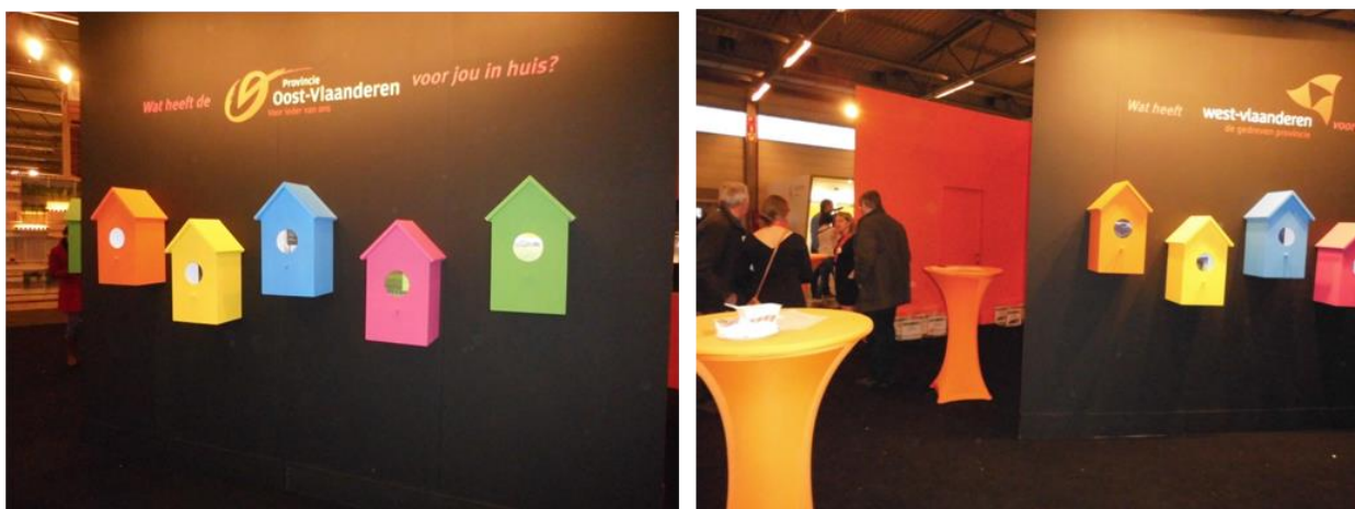
Interprovinciale stand op Agriflanders

De provincies namen gezamenlijk deel aan Agriflanders 2015 met een interprovinciale stand.