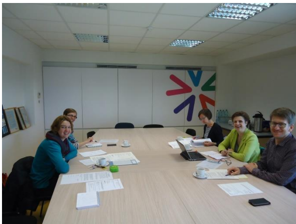
Interprovinciaal Kenniscentrum Milieu

In de werkgroep die werkt rond wetgeving werd heel wat werk verricht. Nadat VVP op 9 februari minister J. SCHAUVLIEGE een brief bezorgde over handhavingsbevoegdheid, werd er een nota opgemaakt met potentiële pistes waarop de provincies kunnen inzetten m.b.t. handhaving. Samen met de bestuursscholen werkte de werkgroep mee aan de opleiding lokaal toezichthouder. Via de werkgroep en met de steun van G. DE SCHUTTER, werd op 24 november 2015 de handhavingsnetwerkdag milieu en ruimtelijke ordening van VHRM (Vlaamse Hoge Raad Handhavingsraad voor Milieu en Ruimtelijke Ordening) in goede banen geleid door de provincies en werd er gewaakt dat er voldoende provinciale input was.