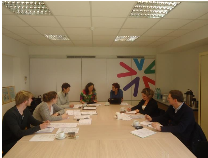
Dagelijks Bestuur Monumentenwacht Vlaanderen

jaarverslag van de vzw zelf, maar een niet te onderschatten verwezenlijking betreft de eerste structurele aanpassing van de tariefstructuur. Dit tariefplan zorgt voor grotere eenduidigheid, maakt lidmaatschap exclusiever, legt de klemtoon meer op de nazorg en gezien de tarieven meer marktconform gemaakt werden, kunnen deze op termijn ook leiden tot meer inkomsten uit de geleverde prestaties. Aan het lidgeld zelf werd niet geraakt.