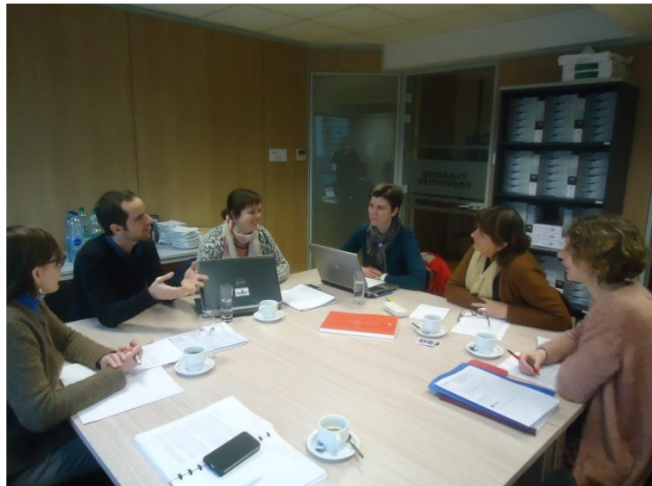
VVP-Werkgroep Onderzoekers Toerisme

TVL nam vroeger reeds de leiding in een aantal onderzoeken zoals het 'Onderzoek dagtoerisme' en het 'Onderzoek Vlaanderen Vakantieganger'. In maart werden de PTO's een eerste keer geïnformeerd dat de kans groot is dat TVL in de toekomst enkel nog onderzoek zal verrichten m.b.t. buitenlandse toeristen. Dit werd bevestigd tijdens een vergadering op 18 juni 2015. De provincies menen dat TVL