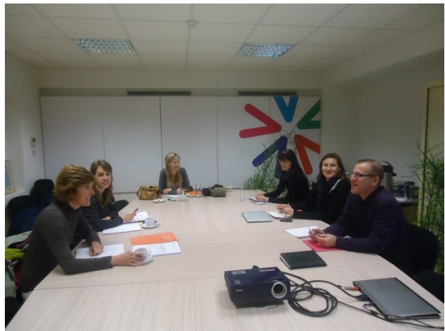
Subcommissie Sociale Economie

In de loop van 2015 werd verder gezocht naar samenwerkingsmogelijkheden op het vlak van collectieve ondersteuning voor de sector. Voor collectieve ondersteuning Sociale Economie werd afgesproken dat elke provincie, complementair aan Vlaanderen, initiatieven neemt om individuele projecten concreet te ondersteunen (met subsidies of andere). Binnen het kader van Maatschappelijk Verantwoord Ondernemen hebben de Vlaamse provincies gezamenlijk promotie gevoerd voor de brede sector van de Sociale Economie. Er blijft bij de Vlaamse provincies een bezorgdheid over de gemeenten die geen Vlaamse subsidies hebben gekregen voor de uitwerking van een regierol lokale diensteneconomie. Het blijft van belang om hen te informeren over wat er daarrond kan gebeuren. VVP stelt uitdrukkelijk de vraag om de provincies bij de monitoring te betrekken. Het is van belang cijfers ter beschikking te hebben, goed ontsloten en bruikbaar, in functie van een onderbouwing van het provinciale en gemeentelijke beleid.