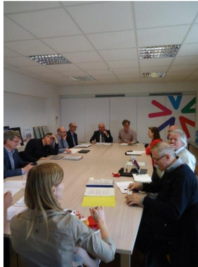
Gezamenlijke zitting beleidscommissie Milieu – Ruimtelijke Ordening

Op 16 januari 2013 werd een gemeenschappelijke vergadering van de beleidscommissies Milieu en Ruimtelijke Ordening georganiseerd ter voorbereiding van een overleg met beide bevoegde ministers (J. SCHAUVLIEGE en Ph. MUYTERS). Op deze gezamenlijke beleidscommissie werd een SWOT – analyse van het proces van totstandkoming van de Omgevingsvergunning opgesteld en een aantal aandachtspunten/standpunten bij de Omgevingsvergunning opgesteld.