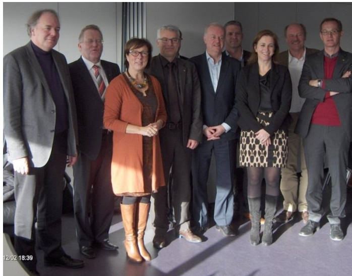
Ondertekening van de samenwerkingsovereenkomst VVP-VLM

Op 2 december werd een samenwerkingsovereenkomst VVP-VLM ondertekend met als doel hun samenwerking te versterken inzake gebiedsgerichte samenwerking, de voorbereiding en uitvoering van PDPO III, informatie-uitwisseling en netwerkvorming inzake agronatuurbeheer en duurzame bemesting, interbestuurlijk overleg, uitwisseling van gegevens en gezamenlijke communicatie-initiatieven.