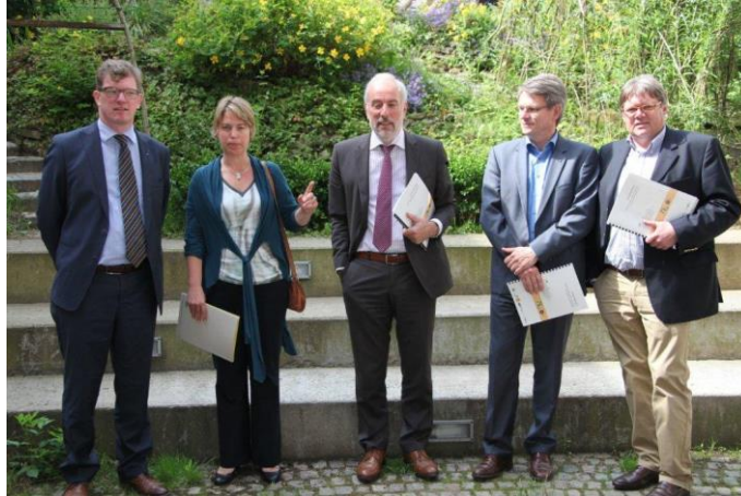
Ondertekening MOS - overeenkomst