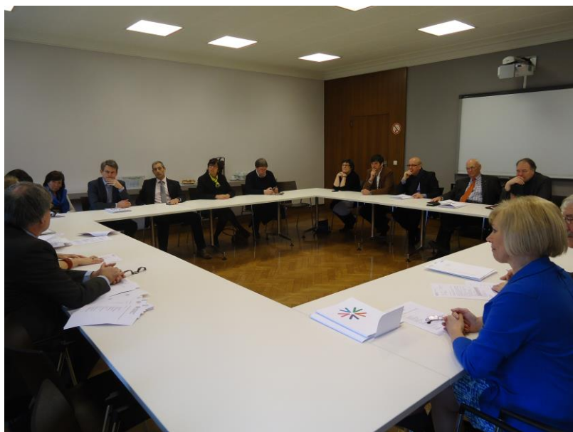
Eerste zitting van de nieuw samengestelde Raad van Bestuur (2 maart 2013)