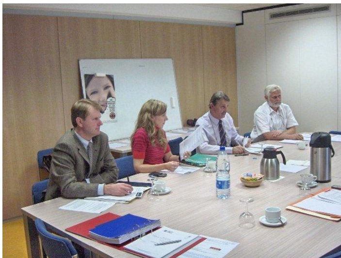
Vergadering beleidscommissie Ruimtelijke Ordening