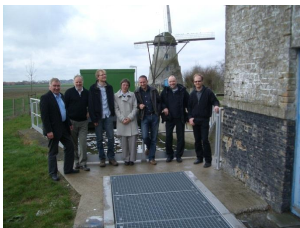
Werkbezoek A-commissie Water

Om innovatieve projecten te tonen en ervaringen erover uit te wisselen organiseert de a-commissie jaarlijks 1 werkbezoek. Dit keer was de provincie Oost-Vlaanderen gastheer. We bezochten het bufferbekken op de Vrasenebeek te Sint-Niklaas, het Armentruyenbeekproject en het gemaal Hondsnest te Sinaai en het project Hooglatem te Sint-Martens-Latem.