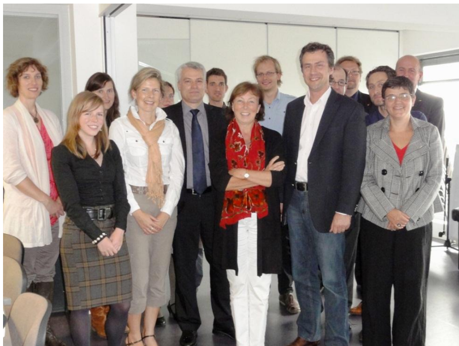
Leden van A en B-commissies landbouw en platteland en VLM bespraken op 5 oktober verdere samenwerking

Op 5 oktober vond een overleg plaats op hoog niveau tussen VLM en VVP. Het was een unieke gelegenheid waarop de VLM een uitgebreide toelichting gaf van hun nieuwe beheersovereenkomst met de Vlaamse overheid. Doelstelling van het overleg was om, nu de rollen van beide overheden binnen de interne staats hervorming verduidelijkt zijn, op diverse terreinen actief samen te werken.