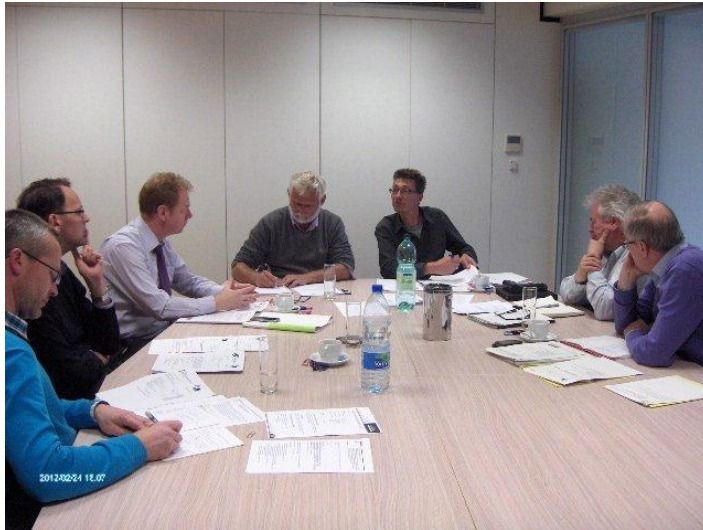
Vergadering ambtelijke adviescommissie Milieu

In de tweede helft van september 2011 maakte de VVP een door de gedeputeerden verantwoordelijk voor Milieu goedgekeurde nota “Toekomst van de Samenwerkingsovereenkomst” over aan de minister. Een tiental thema’s, waaronder de ondersteuning van de gemeenten, kwamen daarin in aan bod.