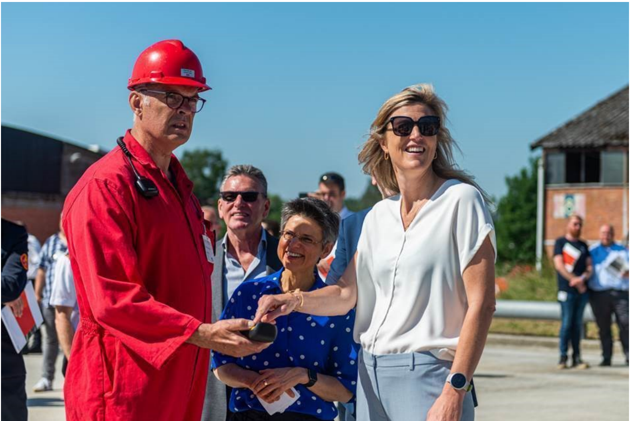
Provincie Antwerpen