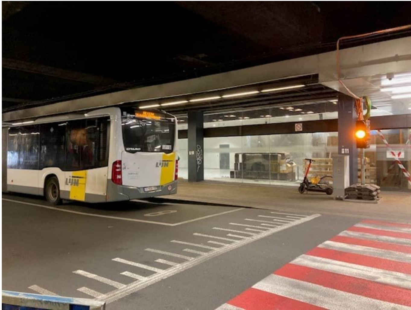
In deze zone komt ook de halte van de pendelbus.